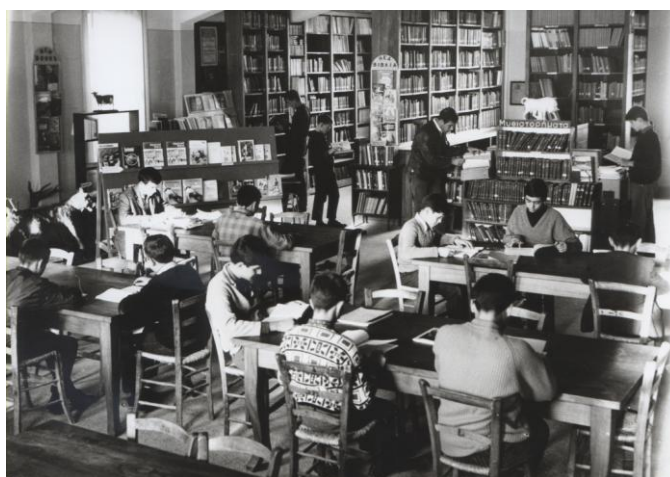
Η βιβλιοθήκη τη δεκαετία 1950

Σε όλη την πορεία μεταμόρφωσης της Σχολής η Βιβλιοθήκη στεκόταν και στέκεται ως ο καταλύτης σε αυτή τη διαδικασία της αλλαγής.