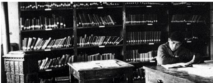
Η Βιβλιοθήκη τη δεκαετία του 1930

Η προσωπική συλλογή του ιδρυτού της Σχολής απετέλεσε και την πρώτη βιβλιοθήκη της. Η συλλογή αυτή αποτελούνταν από βιβλία στην πλειοψηφία τους στην αγγλική γλώσσα και ήταν αγροτικού και κτηνοτροφικού ενδιαφέροντος.